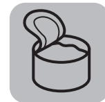
Консервные и другие металлические банки Tins and cans