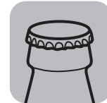
Открыватель для бутылок Bottle opener