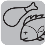
Рыба и мясо Fish and meat