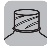
ПЭТ бутылки PET bottles