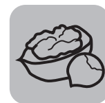
Грецкие и другие орехи Walnuts and other nuts